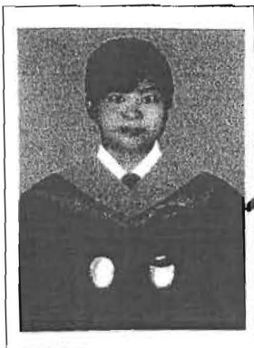
นายทะเบียนลงนามประทับรูป

ให้ไว้ ณ วันที่ ๒๖ เดือน มีนาคม พ.ศ. ๒๕๕๙