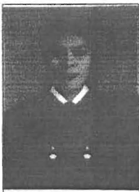
นายทะเบียนลงนามประทับรูป

ให้ไว้ ณ วันที่ ๒๓ เดือน มกราคม พ.ศ. ๒๕๕๙