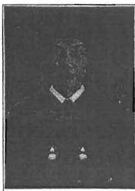
นายทะเบียนลงนามประทับรูป

ให้ไว้ ณ วันที่ ๒๓ เดือน มกราคม พ.ศ. ๒๕๕๙