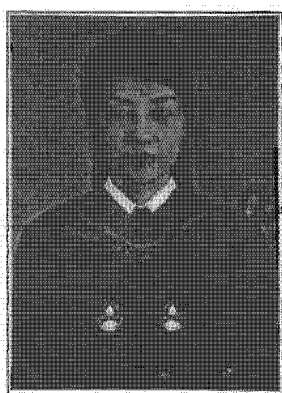
นายทะเบียนลงนามประทับรูป

ให้ไว้ ณ วันที่ ๒๓ เดือน มกราคม พ.ศ. ๒๕๕๙