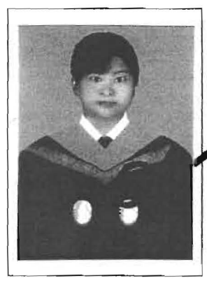
นายทะเบียนลงนามประทับรูป

ให้ไว้ ณ วันที่ ๒๖ เดือน มีนาคม พ.ศ. ๒๕๕๙