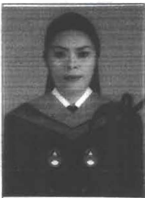
นายทะเบียนลงนามประทับรูป

ให้ไว้ ณ วันที่ ๒๓ เดือน มกราคม พ.ศ. ๒๕๕๙